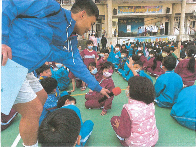
114 學年度「家庭母語月-講母語·造家作伙來」母語週記互動記錄表